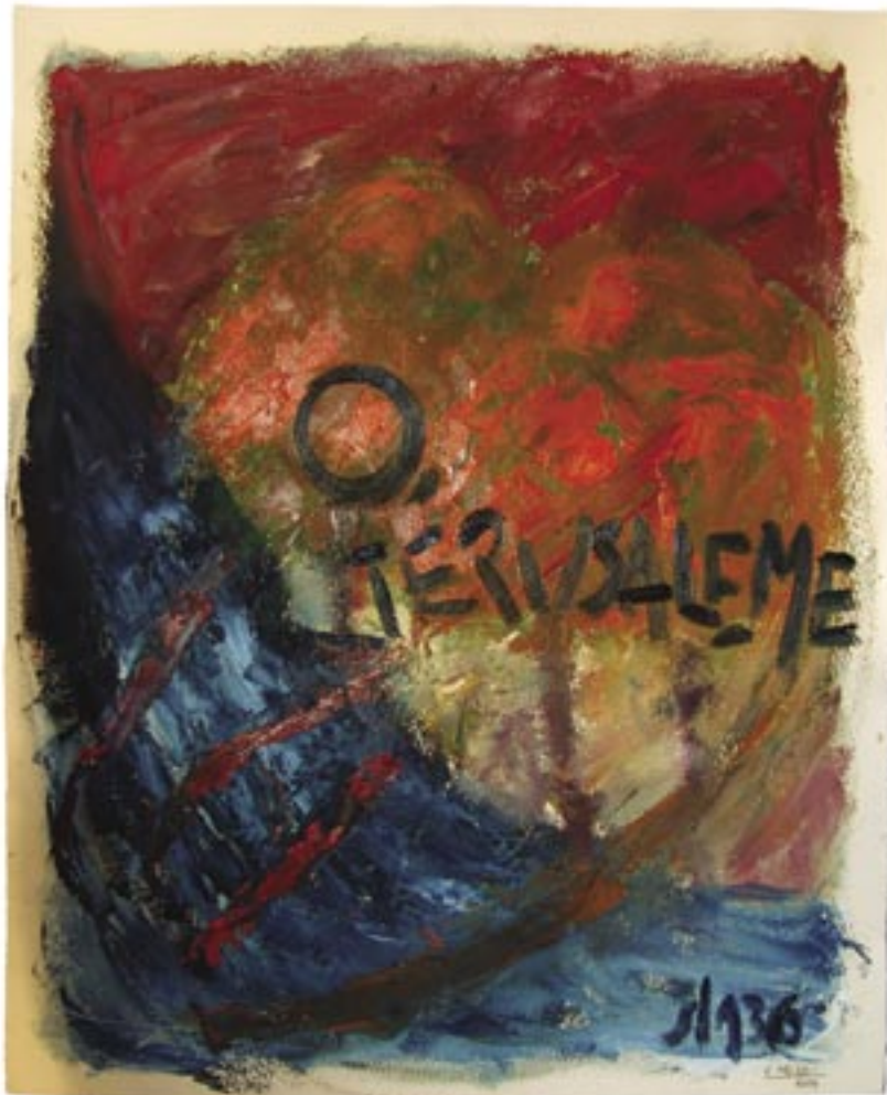
Carme Miró. Oli sobre paper. 65x53 cm. Març-abril del 2004