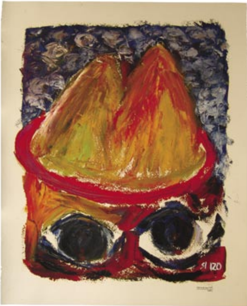
Carme Miró. Oli sobre paper. 65x53 cm. Març-abril del 2004