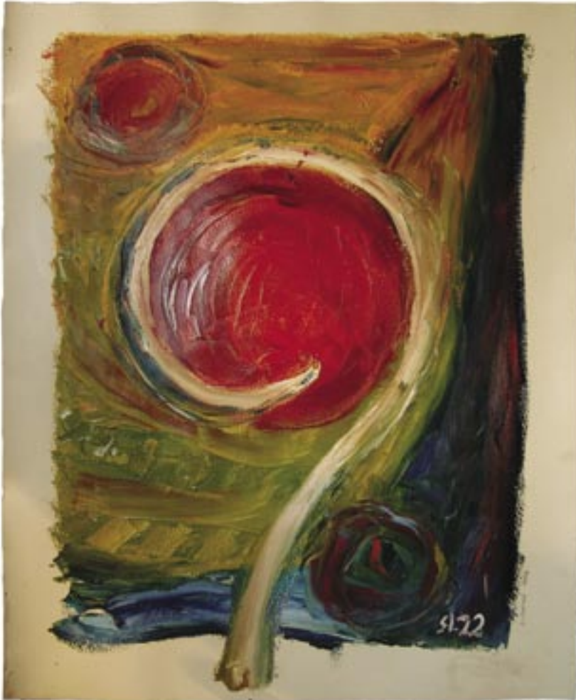
Carme Miró. Oli sobre paper. 65x53 cm. Març-abril del 2004