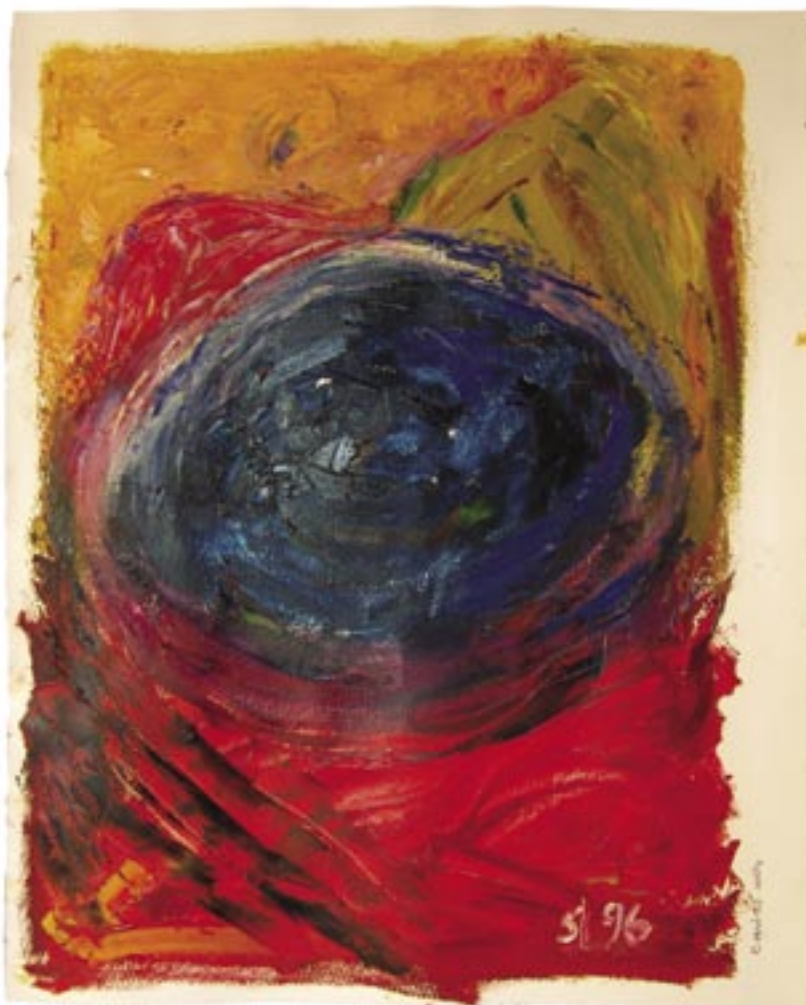
Carme Miró. Oli sobre paper. 65x53 cm. Març-abril del 2004