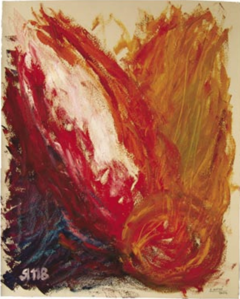
Carme Miró. Oli sobre paper. 65x53 cm. Març-abril del 2004