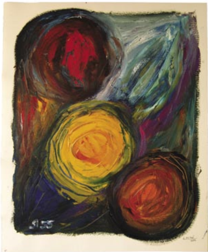
Carme Miró. Oli sobre paper. 65x53 cm. Març-abril del 2004