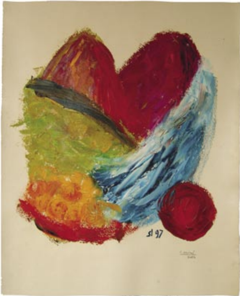
Carme Miró. Oli sobre paper. 65x53 cm. Març-abril del 2004