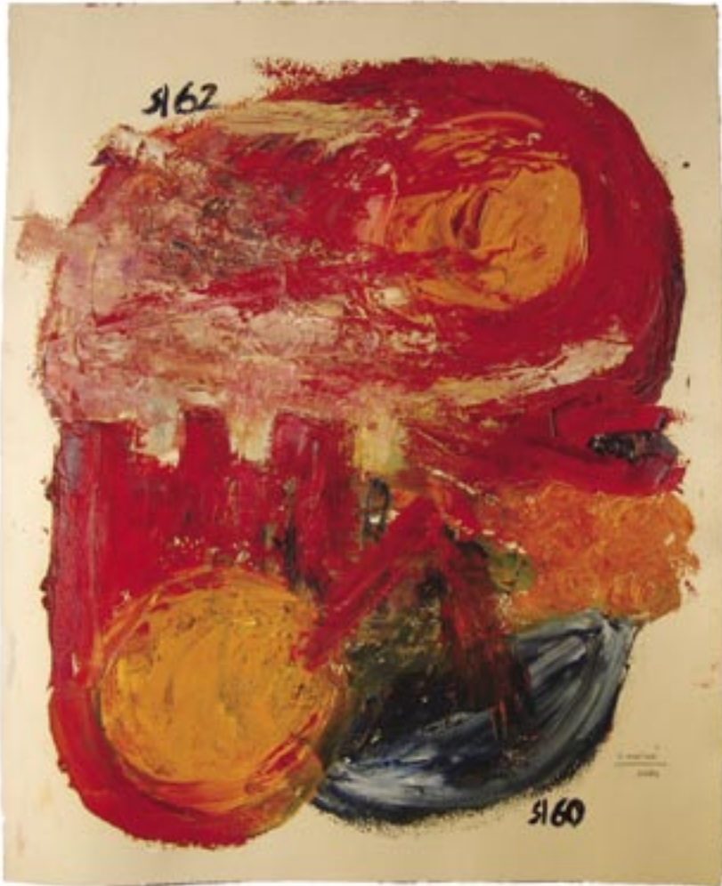
Carme Miró. Oli sobre paper. 65x53 cm. Març-abril del 2004