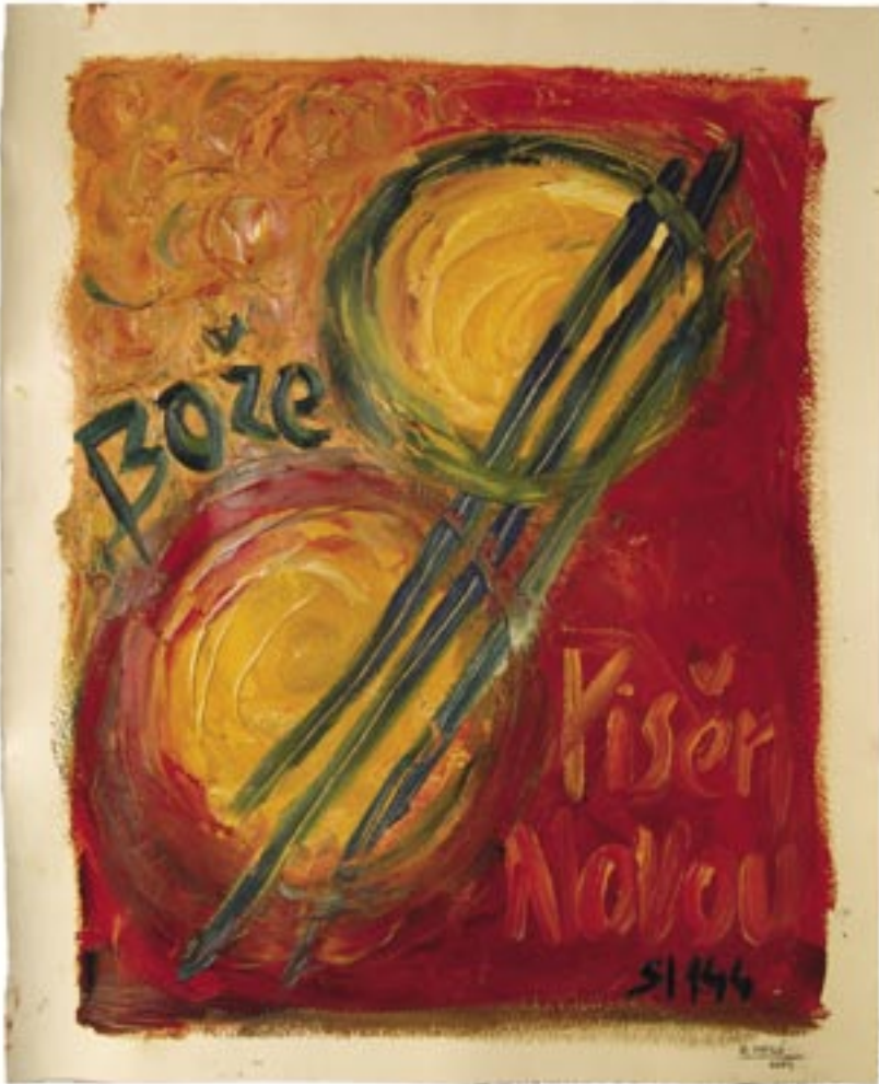
Carme Miró. Oli sobre paper. 65x53 cm. Març-abril del 2004